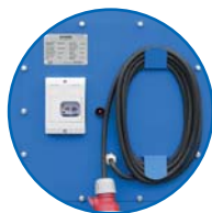
panel kontrolny z uchwytem na kabel