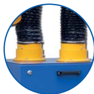
dwa wloty 160 mm